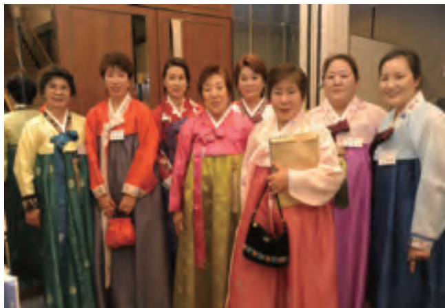
《創立 50 周年記念式典並び新年会で参加役員達》

※時期を見計らい何か行事を考えて行きたいと思っておりますので、 ご了承下さいますようお願い申し上げます。