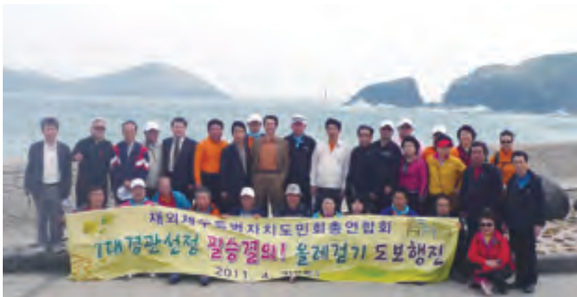
7大景観選定必勝決意オルレ徒歩行進記念