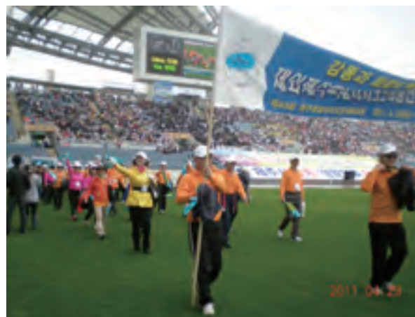
体育大会開幕式で在外道民選手団入場