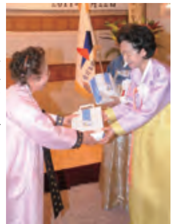
← 高榮修濟州商工会議所会長ご夫人