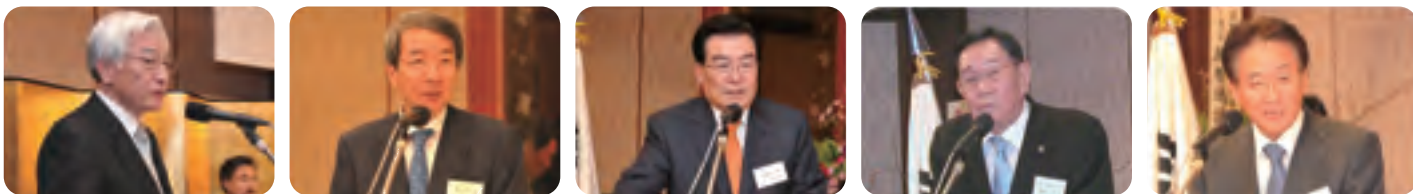
【左から呉賛益日本地域委員長、鄭雲燦委員長、禹瑾敏濟州道知事、鄭進民団中央本部団長、李京秀政務公使】

のみならず、日本、中国を含む北東アジアの宝の島として、世界七大自然景観に向け、私は最大の努力をする所存であります。