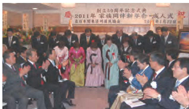
→ 役員一同新年御挨拶