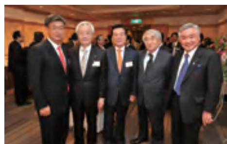
↓ 当日の様子が掲載された新聞