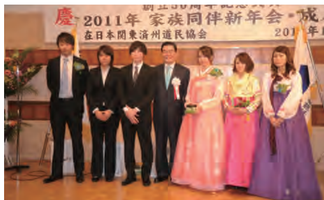
⇒ 新成人と禹瑾敏道知事(真中)