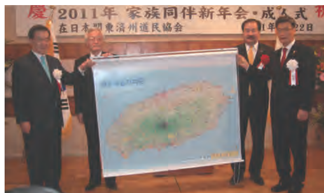
→ ロールスクリーン贈呈式